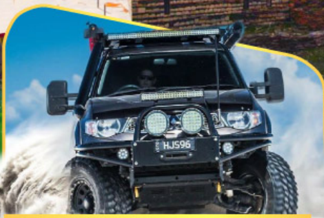
ขึ้นรถ 4WD สู้ใจกลางเทือกเขาคอเคซัส