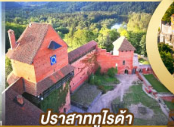
ปราสาทกูโรต้า