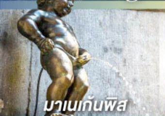
มานเนกันพิส