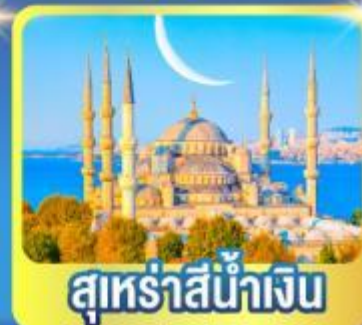
สุร่ายน้ำเงิน