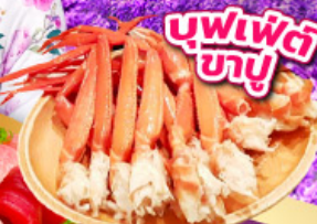
บุฟเฟ่ต์ ชาบู