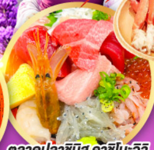
ตลาดปลาซิมิสุ คาชิโนะอิชิ