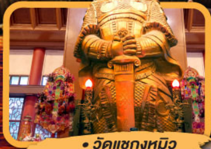
• วัดแซงหมิว