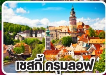
เซสกีครุมลอฟ

ฮังการี สโลวาเกีย ออสเตรีย เชก 7 วัน 4 คืน