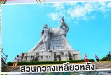
สวนทิวทัศน์ไหหลำ