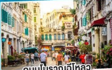
ถนนโบราณไหหลำ