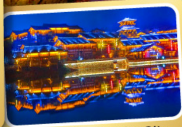
Oriental Salt Lake City