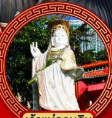
เจ้าแม่กวนอิม รaffles เบย์