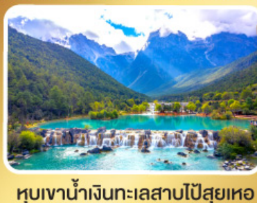
หุบเขาน้ำเงินทะเลสาบโป้สุยเหอ