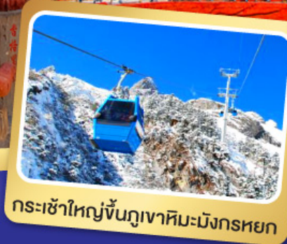
กระเช้าใหญ่ขึ้นภูเขาหิมะมังกรหยก