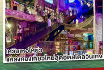
เทวียนหอไหย่ แหล่งท่องเที่ยวใหม่สุดฮิตสไตล์ลูนเทจ