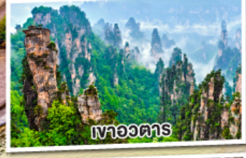
เหวอวตาร