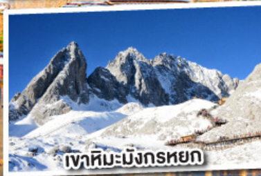
เขาสหิมะมังกรหยก