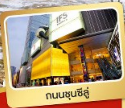
ถนนชุนชิลู่