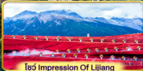
โชว์ Impression Of Lijiang