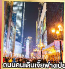
ถนนคนเดินเจียวฟางเป่ย์