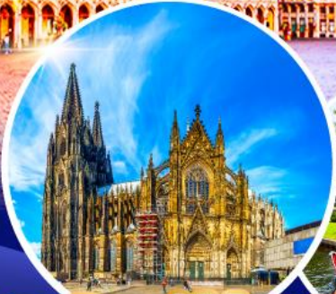
มหาวิหารแห่งโคโลญ