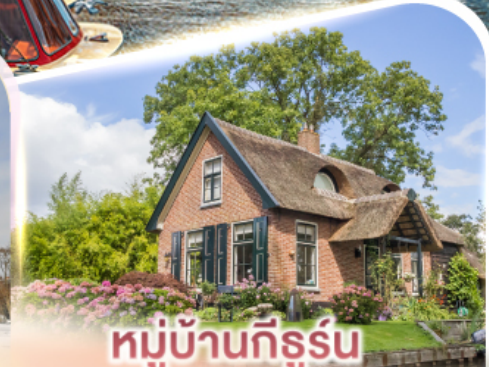
หมู่บ้านกิธูร์น