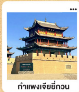
ถ้ำเพงเจียยี่กวน