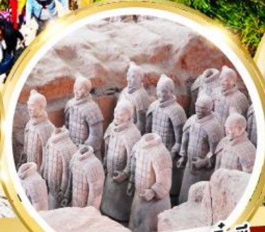
กองทัพทหารดินเผาจีนซี