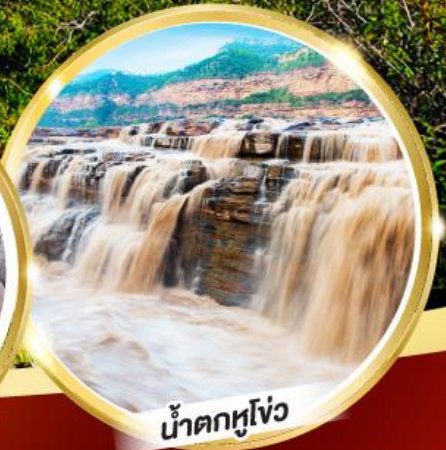
น้ำตกหูโง่