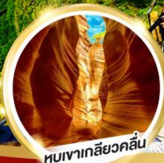
หุบเงาเกลียวคลื่น