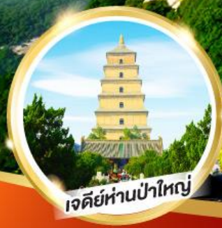
เจดีย์ห่านป่าใหญ่