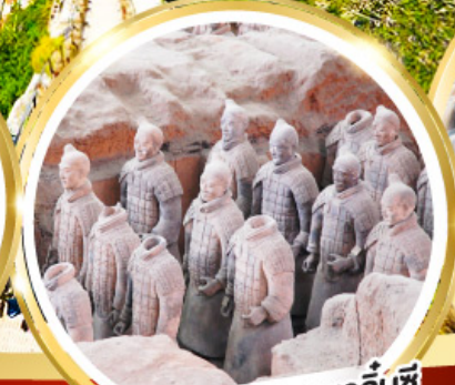
กองทัพทหารดินเผาจีนซี