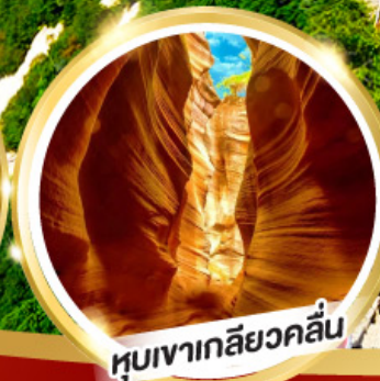
หุบเขาเกลียวคลื่น