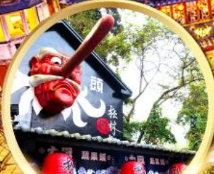
หมู่บ้านปศาจซีโกว