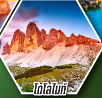
โดโลไมท์

โปรแกรมพิเศษ เก็บครบจบ อิตาลี ตั้งแต่เหนือถึงใต้