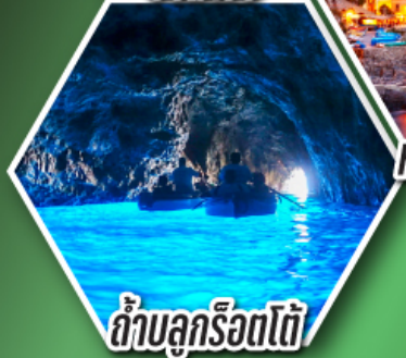
ถ้ำลูกรोटโต