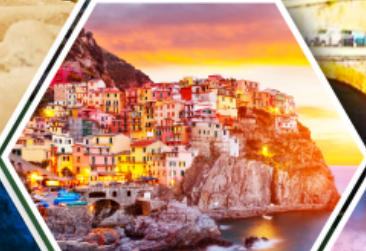
หมู่บ้านมาราโรลา