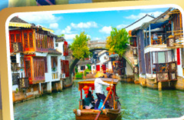
ล่องเรือเมืองโบราณจูเจียเจียว