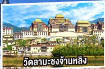
วัดลามะซงจ้ำหลี่