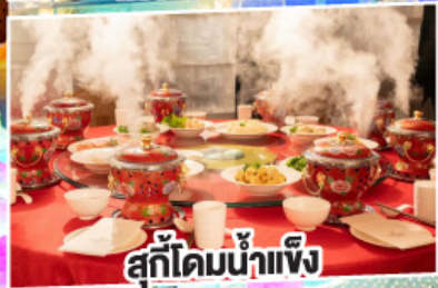
สุกี้ไต้มน้ำแข็ง