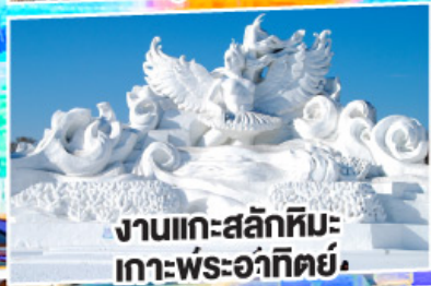
งานแกะสลักหิมะ เกาะพระอาทิตย์