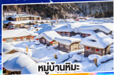
หมู่บ้านหิมะ