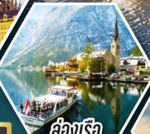
ล่องเรือ ทะเลสาบอัลสตัด