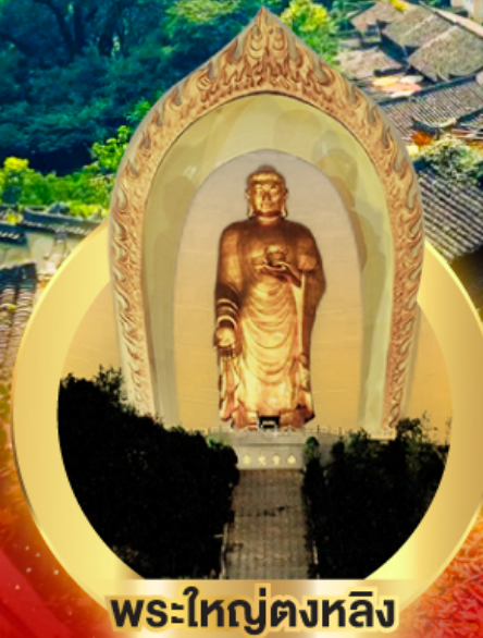
พระใหญ่ตงหลิง