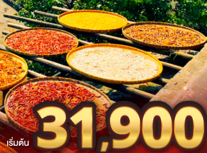
เริ่มต้น