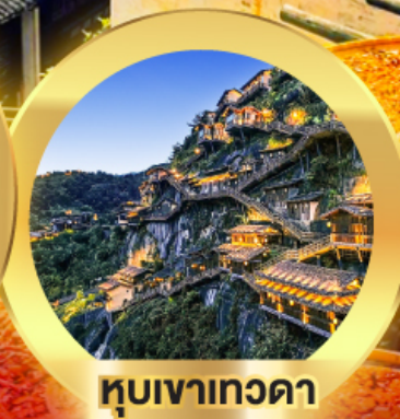
หุบเขาเทวดา