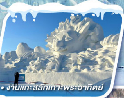
• งานแกะสลักเทว-พระอาทิตย์