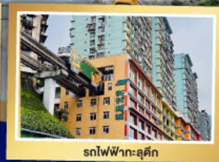
รถไฟฟ้า-ลูตึก