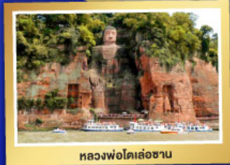
หลวงฟ่งโตเล่อซาน