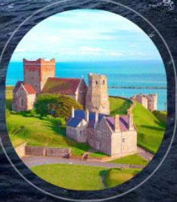
United Kingdom Dover