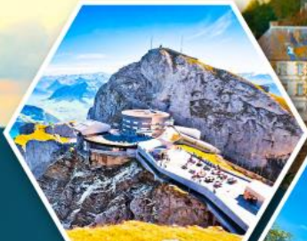
ยอดเขาพิลาตัส