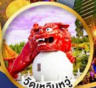
วัดเหวินทง