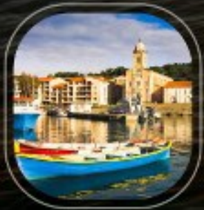
France Port Vendres