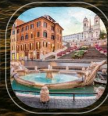
Italy Civitavecchia (Rome)

ราคารวม : ค่าเช่าเรือ, ค่าพนักงาน, อาหารทุกมื้อบนเรือสำราญ | ราคาไม่รวม : ค่าทำวีซ่า, ค่าเครื่องเงิน, ทอร์บนั่ง, อาหารพิเศษ