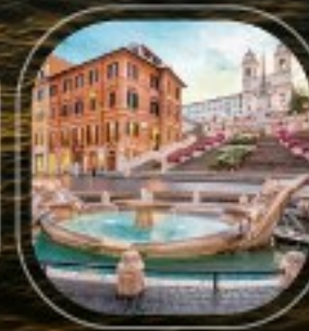
Italy Civitavecchia (Rome)

ราคาต่อคน : 175,900 บาท (รวมค่าเรือ, ค่าที่พักบนเรือ, ค่าอาหารกลางวันและอาหารค่ำ) | ราคาใบเรือ : ค่าค่าตัว, ค่าธรรมเนียม, ค่าธรรมเนียม, ค่าธรรมเนียม