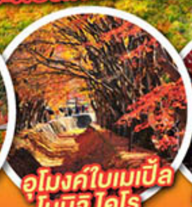
อุโมงค์ใบเมเปิ้ล โมมิจิ โคโร