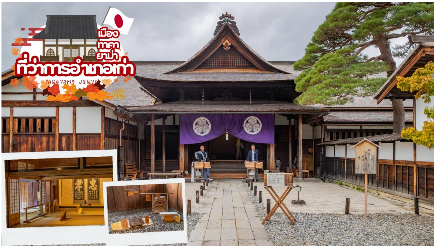
ผ่านชม ทาคายาม่า จินยะ หรือ ที่ว่าการอำเภอเก่าเมืองทาคายาม่า (ไม่รวมค่าเข้าชม) ซึ่งเป็นจวนผู้ว่าแห่งเมืองทาคายาม่า เป็นที่ทำงานและที่อยู่อาศัยของผู้ว่าราชการจังหวัดฮิดะ เป็นเวลากว่า 176 ปี