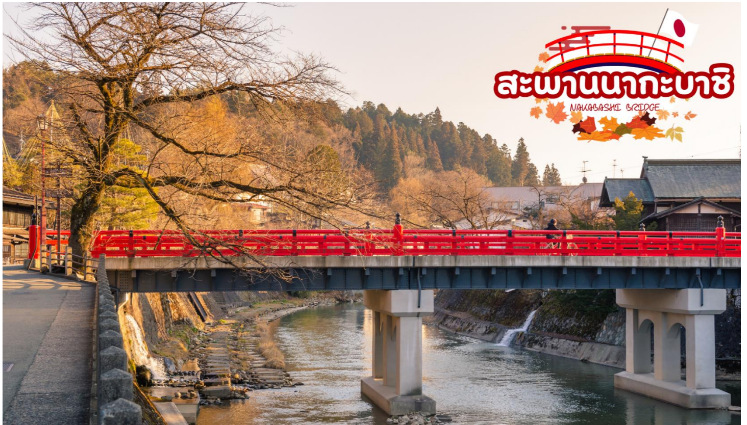
สะพานนากะบาชิ (Nakabashi Bridge) สะพานสีแดงของย่านเมืองเก่า สะพานทอดข้ามแม่น้ำมิกาวาระที่ไหลผ่านใจกลางเมือง สะพานแห่งนี้ถือเป็นสัญลักษณ์ของเมืองทาคายาม่า