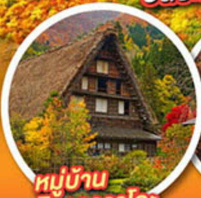
หมู่บ้าน ชิราคาวาโกะ