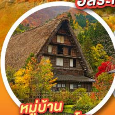
หมู่บ้าน ชิราคาวาโกะ