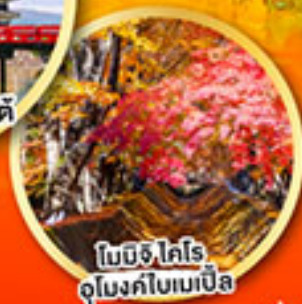
โมมิจิ โคโร อุโมงค์ไบเมเปิล

เที่ยวเต็มทุกวัน ไม่มีฟรีคีย์ พักออนเซ็น 2 คืน พักโตเกียว 1 คืน บินเข้านาโงย่า-ออกโตเกียว