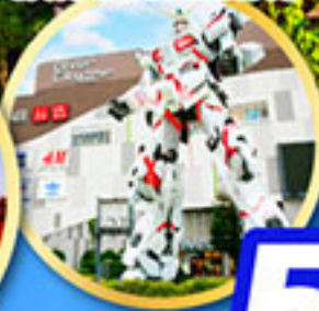
อิสระท่องเที่ยว 1 วันเต็ม