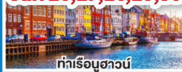
ท่าเรือฮาวน์

เดินทาง 19-26 พ.ย. 67 03-10 ธ.ค. 67 26 ธ.ค. 67-02 ม.ค. 68 (ปีใหม่)