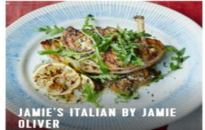
JAMIE'S ITALIAN BY JAMIE OLIVER