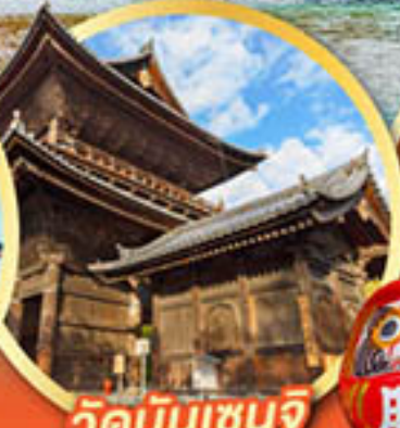
วัดนินเซินจิ