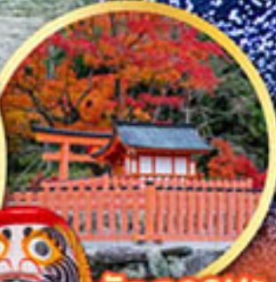
วัดคารุมะ