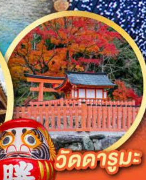
วัดคารุมะ