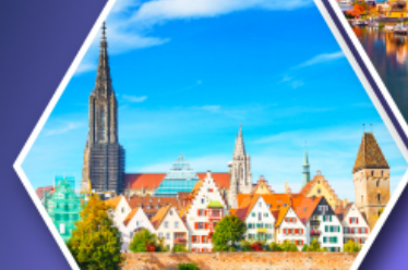
อุล์มบ้านเกิดไอน์สไตน์