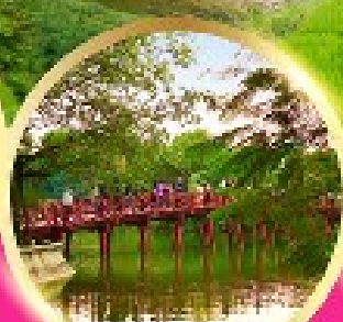
ทะเลสาบคินคาน