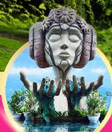
โมอาน่า ซาปา คาเฟ่