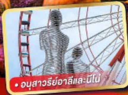
• อูบาสวารียาลิและนิโบ