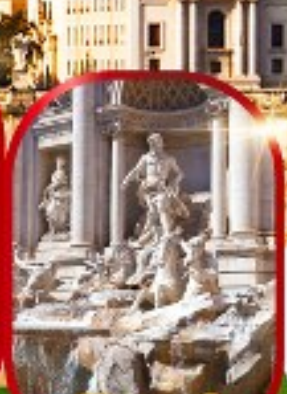
น้ำพุเทรวี่

เดินทาง 15-22 พ.ย.67 28 พ.ย. - 5 ธ.ค.67 26 ธ.ค.67 - 2 ม.ค.68(ปีใหม่) 28 ธ.ค.67 - 4 ม.ค.68(ปีใหม่)