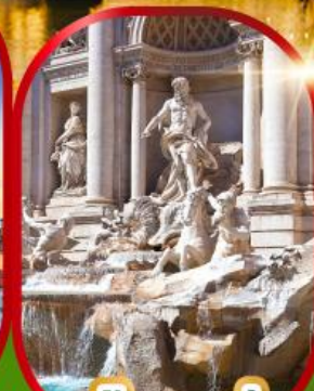
น้ำพุเทรวี่