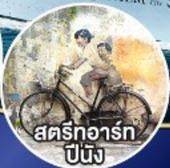
สตรีทอาร์ต ปีนัง