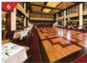
Dream Dining Room Savour a wide variety of Asian and international cuisine.