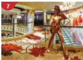
Johnnie Walker House™ Immerse yourself in the intricate world of premium Scotch whisky.