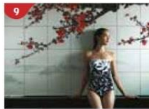
Crystal Life™ Spa Rejuvenate mind, body and soul with our holistic Western and Asian spa experience.