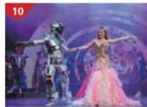
Zodiac Theatre Enjoy live production shows from the acclaimed award-winning entertainment team.