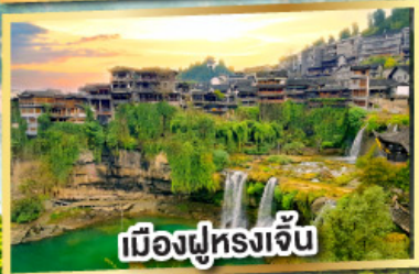
เมืองฝูหลงเจิน