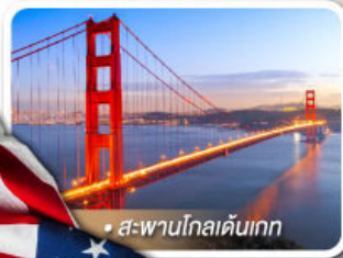
สะพานโกลเดนเกต

★ เยือนอุทยานแกรนด์แคนยอน ฝั่ง South rim ความมหัศจรรย์ทางธรรมชาติที่ยิ่งใหญ่ที่สุดแห่งหนึ่งของโลก