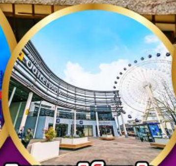
มิตซูเอากะไลท์พาร์ค เซนได