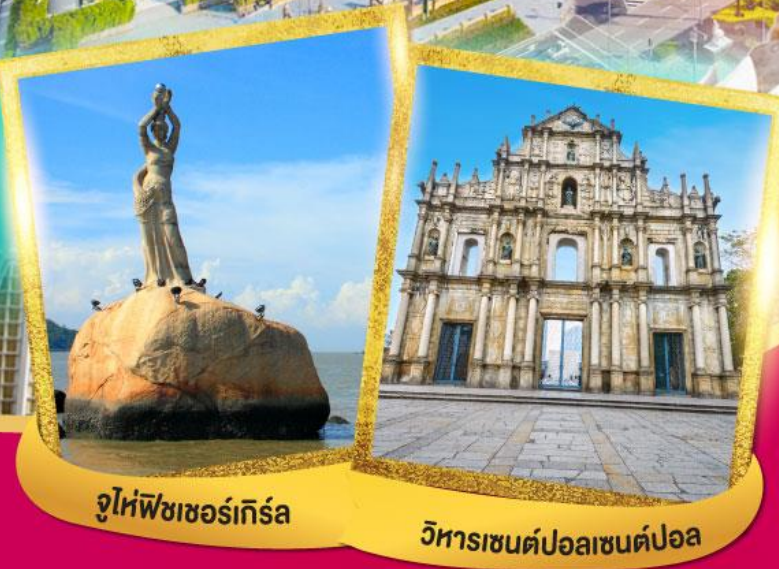
จูไห่พีชเชอร์เกิร์ล