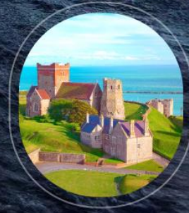
United Kingdom Dover

ราคารวม : อาหารทุกมื้อบนเรือสำราญ, ทิปพนักงานบนเรือ, ภาษีท่าเรือ | ราคาไม่รวม : ตัวเครื่องบิน, ค่าทำวีซ่า, ที่วีซ่าเสริมบนฝั่ง